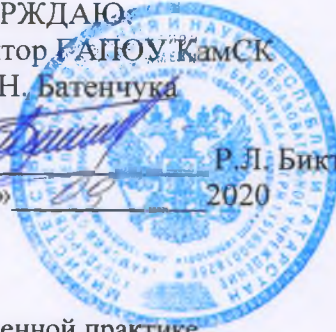
График проведения консультаций и прием зачетов по производственной практике на отделении подготовки специалистов среднего звена очной формы обучения I семестра 2020/2021 учебного года